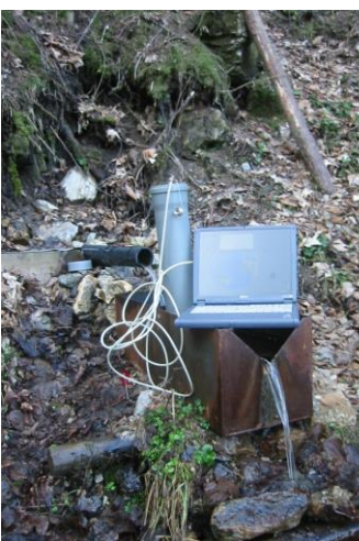
Abflussmessstation mit Datensammler

Im Bereich des Untersuchungsgebiets wurden insgesamt ca. 130 Wasservorkommen aufgenommen und die erhobenen Geländedaten (GPS-Ko-