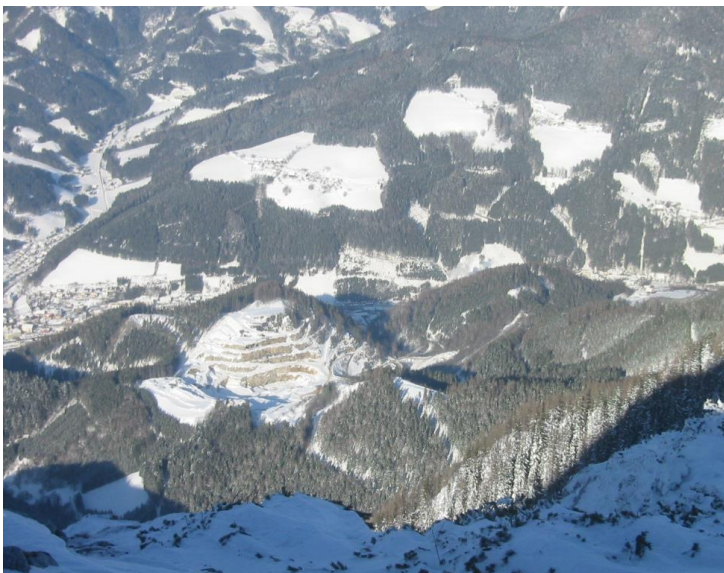
Magnesitbergbau Breitenau – Tagbau; Blick vom Hochlantsch nach Norden

In einem ersten Untersuchungsschritt wurde die Verbreitung und Ausbildung der lithologischen Einheiten durch eine geologische Kartierung erfasst. Eine Detailbear-